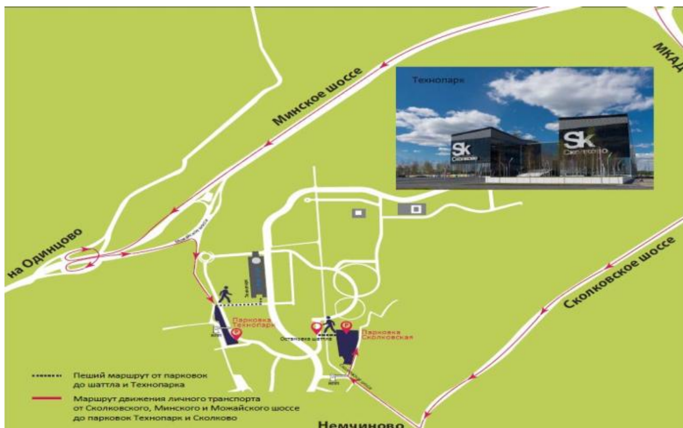
Схема расположения парковок на территории «Сколково»